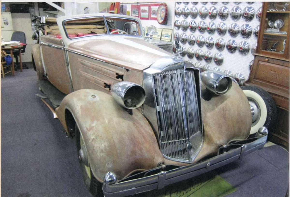
Packard V12, nuläge.