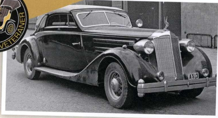
PACKARD V12 1936