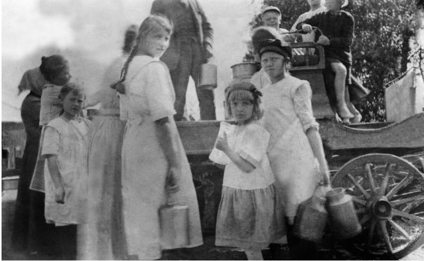
Bild nr 10635 Mjölkstransport till Vivsta. Foto Eva Lindmark ca 1930.

Med de växande industrisamhällena efter kusten ökade behovet av nära dagliga transporter av främst mjölk. Det löstes genom att man ofta gick samman byavis och utsåg någon som fick ta häst och vagn och åka till de fasta kunder man hade överenskommelse om mjölkleverans med. Också hästen har en begränsad aktionsradie så mjölktransporter till kusten skedde upp till ungefär byn Fuske men inte längre. Det blev för långt för hästen att gå fram och tillbaka över dagen.