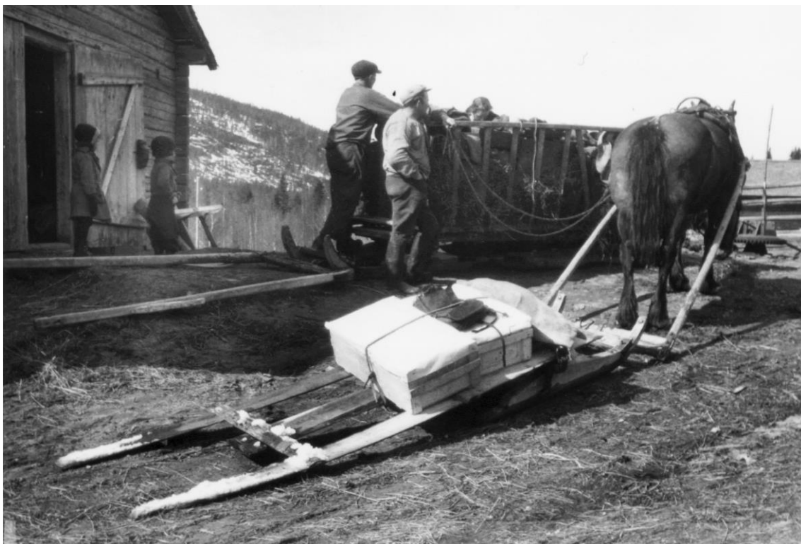
Bild nr 10116. En fjällgigg fotograferad 1919 i byn Fuske av Nordiska Museets utsände. ”Foto i Nordiska Museets arkiv”.

Av brev från slutet av 1800-talet framgår det att man ibland reste in till Sundsvall för att gå på marknad. En sådan stadsresa kunde omfatta en vecka.