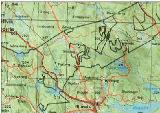
Nya Bjursås. Den moderna kartan över Bjursås ger också en bild av sockens märkliga utseende. "Öarna" inne i utstickaren av Leksands kommun hör till Bjursås.